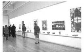
高岡市美術作家連盟展