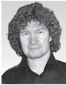
キリル・ロディン (チェロ) Кирилл Родин

1963年モスクワに生まれる。1981年グネーシン記念音楽アカデミーを卒業し、モスクワ音楽院へ進んだ。ベオグラード国際コンクール(1984)、第8回チャイコフスキー国際コンクール(1986)に於いて第1位にかがやき、一躍その名を世界に知らしめた。1989年にモスクワ音楽院を首席で卒業。第12回チャイコフスキー国際コンクールで審査員を務めた。現在は世界中で演奏活動をする傍ら、モスクワ音楽院で後進の指導にあたっている。