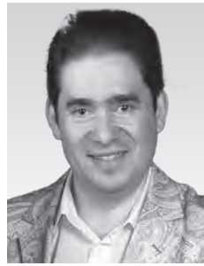
レオニード・ボムステイン (テノール) Леонид Бомштейн

現在、G.ノセダ率いるトリノ王立歌劇場管弦楽団(イタリア)のコンサートマスターをつとめる傍ら、世界中で精力的に演奏活動を行っている。