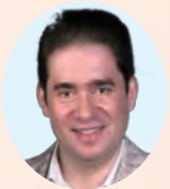
レオニード・ボムSTEIN Леонид Бошштейн