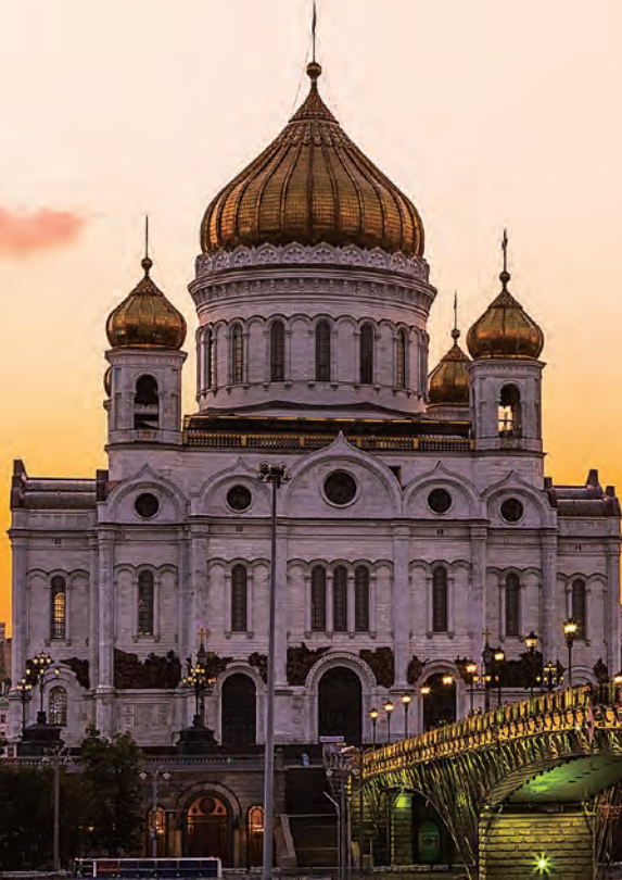
写真：救世主ハリストス大聖堂

■主催：公益社団法人 国際音楽交流協会 (http://www.imea.or.jp/)