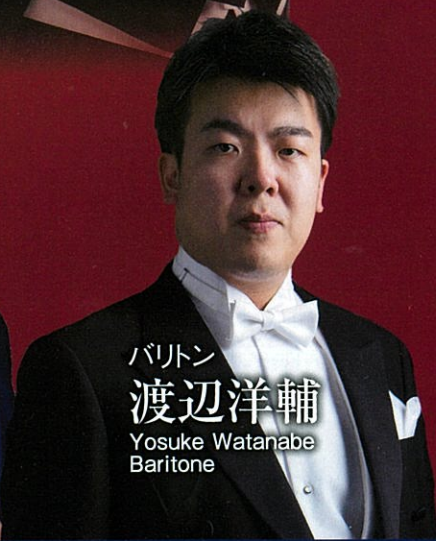
バリトン 渡辺洋輔 Yosuke Watanabe Baritone