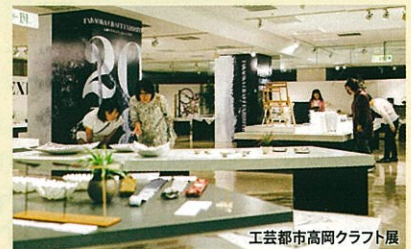
工芸都市高岡クラフト展

お問合せ/工芸都市高岡クラフトコンペ実行委員会、高岡クラフト市場街実行委員会 (高岡商工会議所内) TEL.0766-23-5000 ミラレ金屋町実行委員会(事務局:高岡市商業雇用課) TEL.0766-20-1592