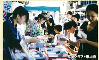
高岡クラフト市場街