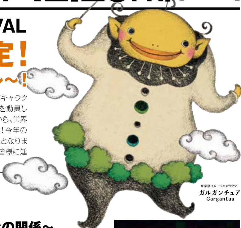
音楽祭イメージキャラクター ガルガンチュア Gargantua

名称を新たに2017年よりスタートした「風と緑の楽都音楽祭」。公式キャラクター「ガルガンチュア君」も大奮闘、北陸3県で2年連続11万人以上を動員した、まさに北陸最大の音楽の祭典です。街なかの気ガルなコンサートから、世界の第一線で活躍する音楽家たちまで、北陸3県で繰り広げる音楽祭! 今年の春の音楽祭4公演は、新型コロナウイルス感染症拡大防止のため中止となりましたが、うち2公演を「冬の音楽祭」と題し、魅力あふれるプログラムで皆様に延期開催してお届けします!