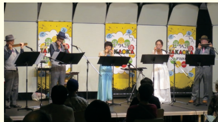
Little Wing ウイング・ウイング高岡1階交流スペース