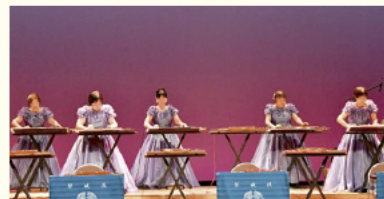
御旅屋セリオ5階マルチスペース