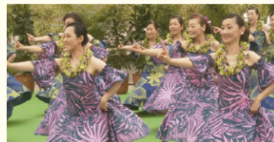
Little Wing ウイング・ウイング高岡1階交流スペース