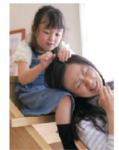
令和3年度大賞作品(一般部門)

開館時間／9:00～17:00(入館は16:30まで) 休館日／月曜(祝・休日の場合は翌日) 問 ミュゼふくおかカメラ館 TEL.0766-64-0550