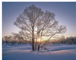
日本の日の出部門

銀塩フィルムによる日本国内の風景写真作品全121点を展示。写真家たちが捉えた一瞬の輝きは、私たちが喜びと感動に満ちた美しい風景の旅へと誘います。