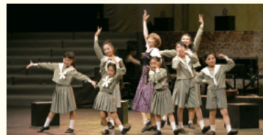
Little Wing ウイング・ウイング高岡1階交流スペース