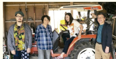
Little Wing ウイング・ウイング高岡1階交流スペース