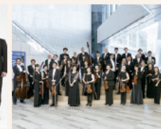
オーケストラ・アンサンブル金沢