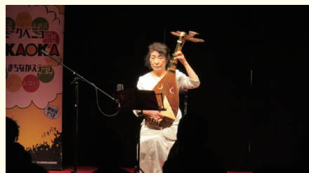
御旅屋セリオ5階マルチスペース