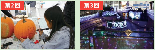
第2回 ハロウィン編 (10月開催予定) 第3回 クリスマス編 (12月開催予定)

ハロウィンとクリスマスの季節に、親子で楽しめる ワークショップを御旅屋セリオ及び御旅屋通り で開催予定です!! 詳細は、開催告知チラシ及び たかおかストリートでご確認ください。