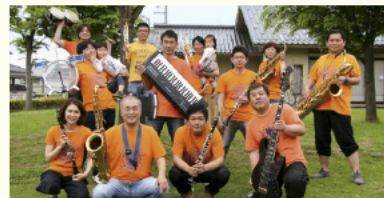
クルン高岡(高岡駅) 2階ベデストリアンデッキ