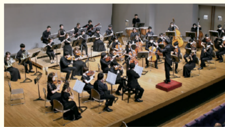
Little Wing ウイング・ウイング高岡1階交流スペース