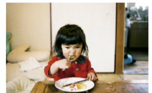
「未来ちゃん」より©川島小鳥

何気ない日常の片隅、あの角を曲がった先。キラキラと光を放つ数えきれないやさしさや美しい営みとの出会いを楽しむように、写真家・川島小鳥は最高の瞬間を物語に散りばめていく。その純粋さが圧倒的な唯一無二の世界に、私たちは夢と現実の境界線を漂うような憧れに似た感動を覚えます。鮮烈なデビューからこれまでの作品を総集編的に紹介し、若者に絶大な人気を誇る写真家の魅力に迫ります。