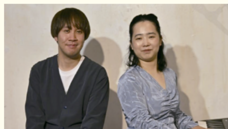
Little Wing ウイング・ウイング高岡1階交流スペース