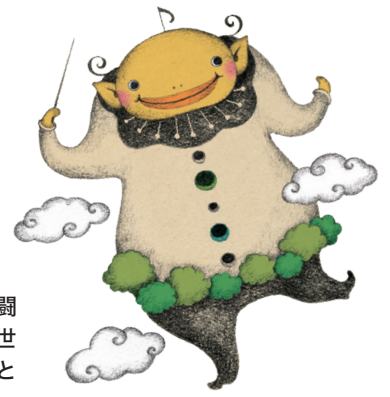
音楽祭イメージキャラクター ガルガンチュア Gargantua

名称を新たに29年度よりスタートした「風と緑の楽都音楽祭」。公式キャラクター「ガルガンチュア君」も奮闘し、北陸3県で11万人を動員した、まさに北陸最大の音楽の祭典です。街なかの気ガルなコンサートから世界の第一線で活躍する音楽家たちまで、今回のテーマ「東欧に輝く音楽 ～プラハ、ウィーン、ブダペスト～」と題し、魅力あふれるプログラムで3日間にわたり3公演開催します。