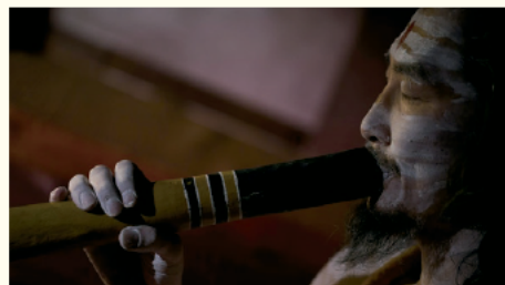
Little Wing ウイング・ウイング高岡1階交流スペース