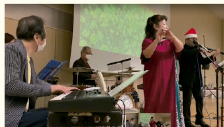
Little Wing ウイング・ウイング高岡1階交流スペース