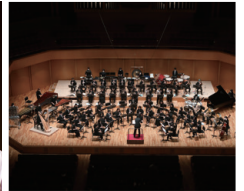
名古屋音楽大学シンフォニック・ウインズ