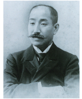
林忠正肖像(個人蔵)

現高岡市一番町出身の美術商・林忠正(1853～1906)は、長年パリで画商として活躍し、ヨーロッパに浮世絵などの日本美術を紹介するなど、東西美術交流に多大な貢献を果たした人物で、令和8年(2026)は林忠正の没後120年となる節目の年にあたります。本展では林忠正が残した書簡などを中心に展示・紹介します。