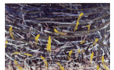
堀浩哉「ローマで鳥を見た14」1991年