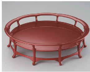
林 曉《朱塗脚付盤》2022年

休館日／月曜 (祝・休日の場合は翌平日) 観覧料／一般800円(団体・シニア640円)、大学生500円(団体400円)、 高校生以下無料 ※林 曉 漆藝展は無料