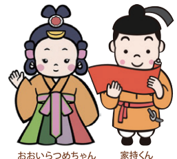
おいらつめちゃん 家持くん

全国の予選を勝ち抜いた高校生チ ームが、お題に沿った短歌を詠み合 い、自チームの歌を褒め、相手チ ームの歌を批評し合う熱いバトル。 高校生ならではのフレッシュで純粋な歌 に思わずキュンとしてしまうかも! この機会に、会場で短歌の魅力に直接 触れてみてください。対決の様子は、 YouTubeで生配信する他、後日、動 画を公開します。こちらも併せてお 楽しみください。最新情報は、HPを ご覧ください。