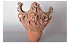
縄文土器 早月上野遺跡出土

休館日／月曜(祝・休日の場合は翌平日) 観覧料／一般800円(団体・シニア640円)、 高校・大学生500円(団体400円)、 中学生以下無料